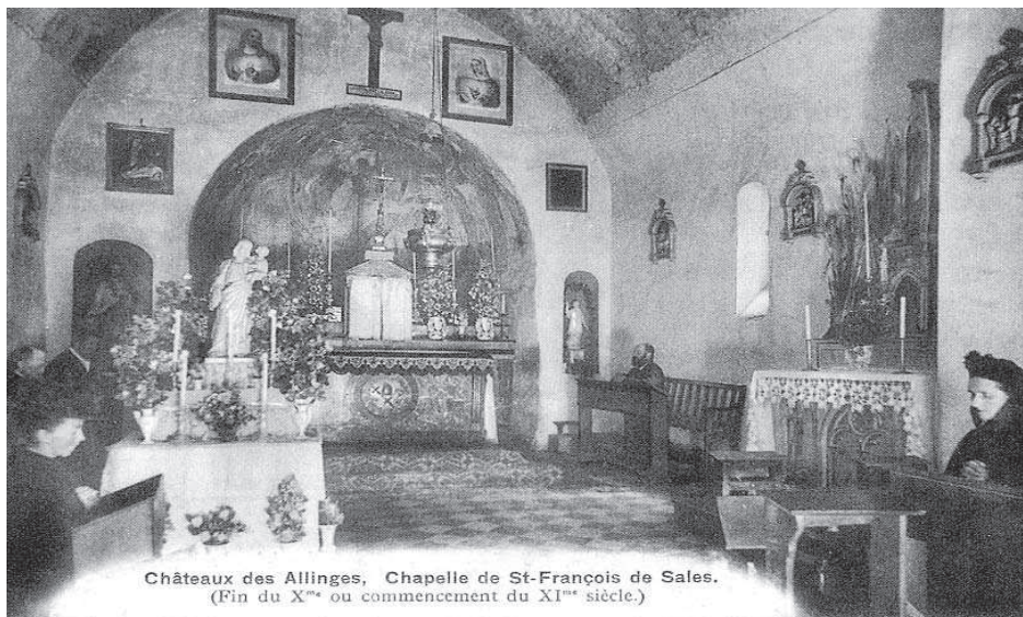
Châteaux des Allinges, Chapelle de St-François de Sales. (Fin du X me ou commencement du XI me siècle.)