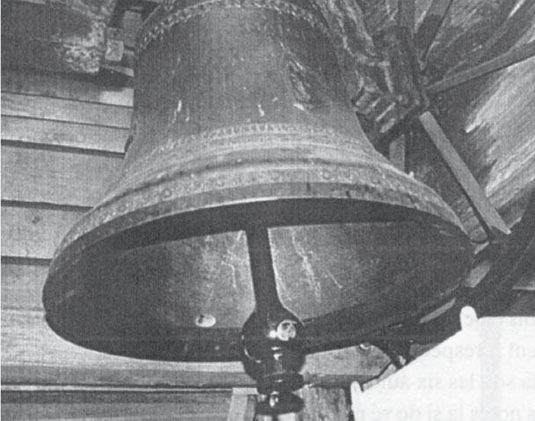
Cloche fondue en 1915 par la maison Paccard

La petite cloche a été fondue en 1915 également par la maison PACCARD son parrain était Pierre CARME, sa marraine Marie DELUER-MOZ.