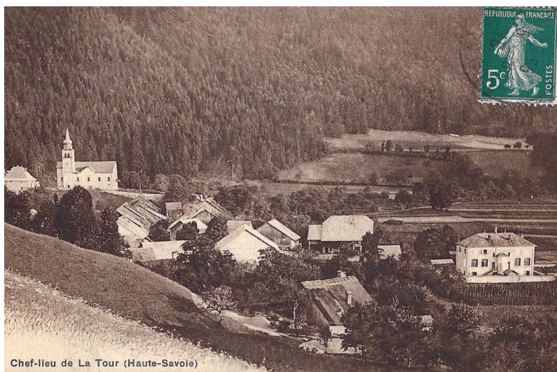
Chef-lieu de La Tour (Haute-Savoie)