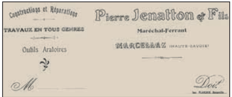
En-tête de factures d'entreprises de Contamine et de Marcellaz ayant travaillé pour la Société de Fruitière