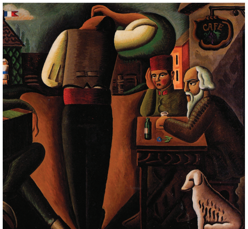
Le Jeu de quilles (1930) huile sur toile (reproduction partielle)