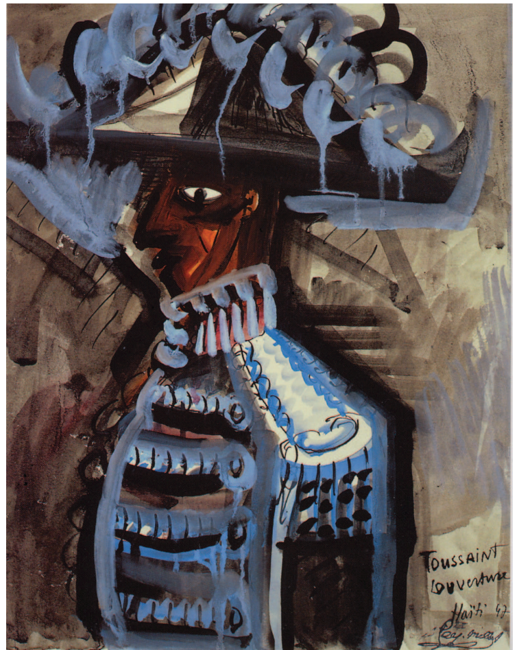
ci-dessous : Toussaint Louverture (1947)